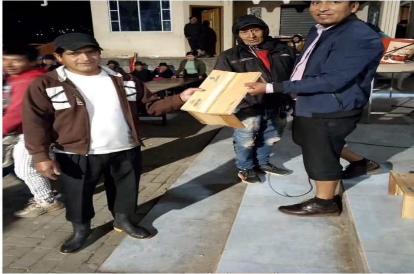
Mingas de limpieza con las diferentes comunidades.